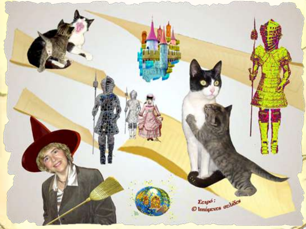
Σειρά: © Ιπτάμενες σελίδες