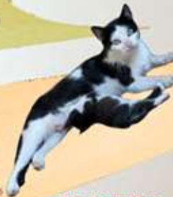
Στο Παραμύθιο ΚΑΣΤΡΟ της Σόνιας Μελό-Φλώρου