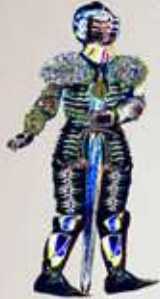
Σειρά: © Ιπτάμενες σελίδες