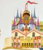
Σειρά: © Ιπτάμενες σελίδες Στο Παραμύθιο ΚΑΣΤΡΟ της Σόνιας Μελό-Φλώρου