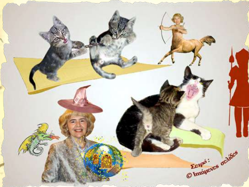
Σειρά: © Ιπτάμενες σελίδες